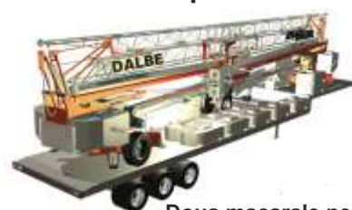
Doua macarale pe un camion